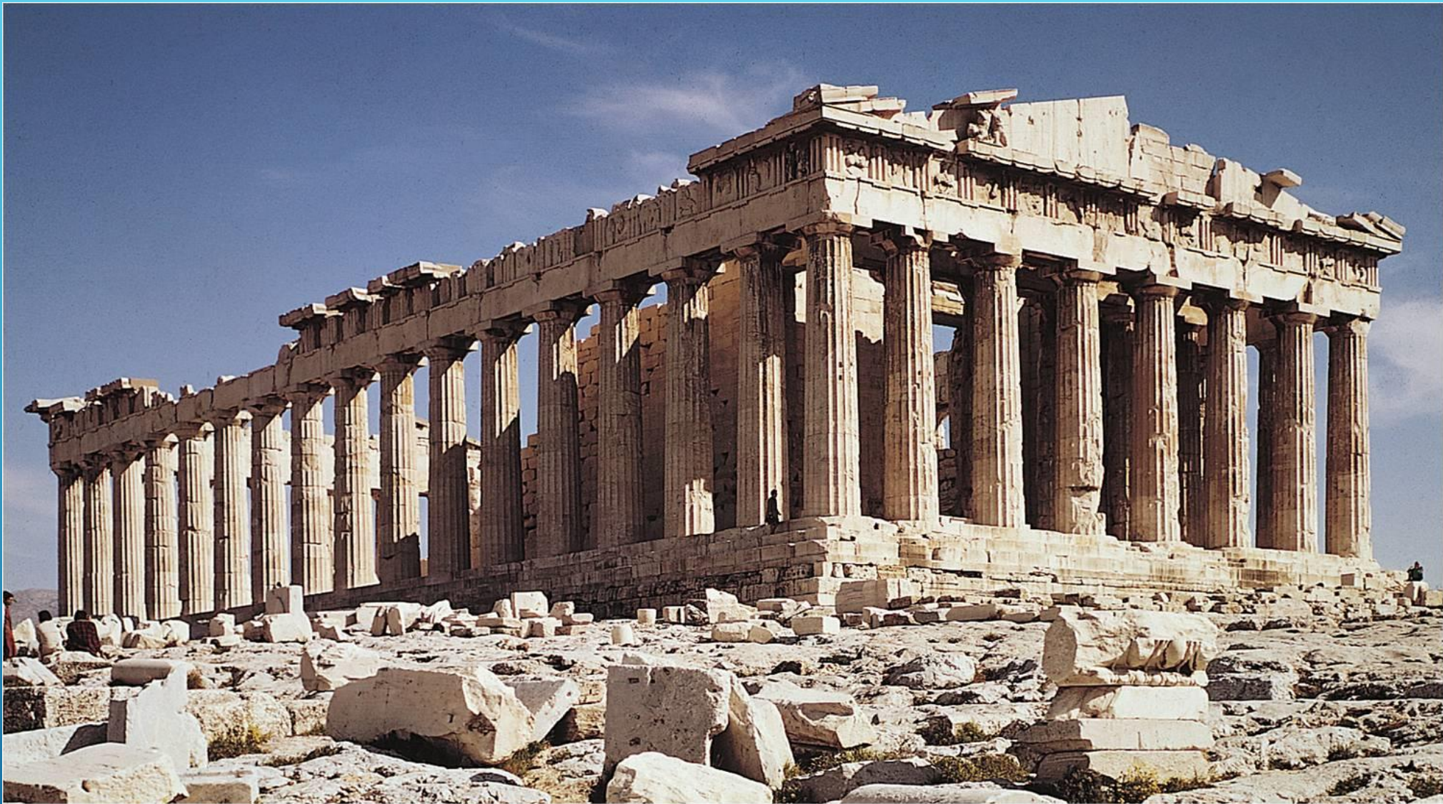
Дорический храм Парфенон, посвященный Афине Парфенос. Начало строительства 447 г. до н.э., храм освятили в 438 г