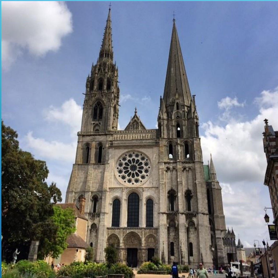
Собор Шартре, XII-XIV вв