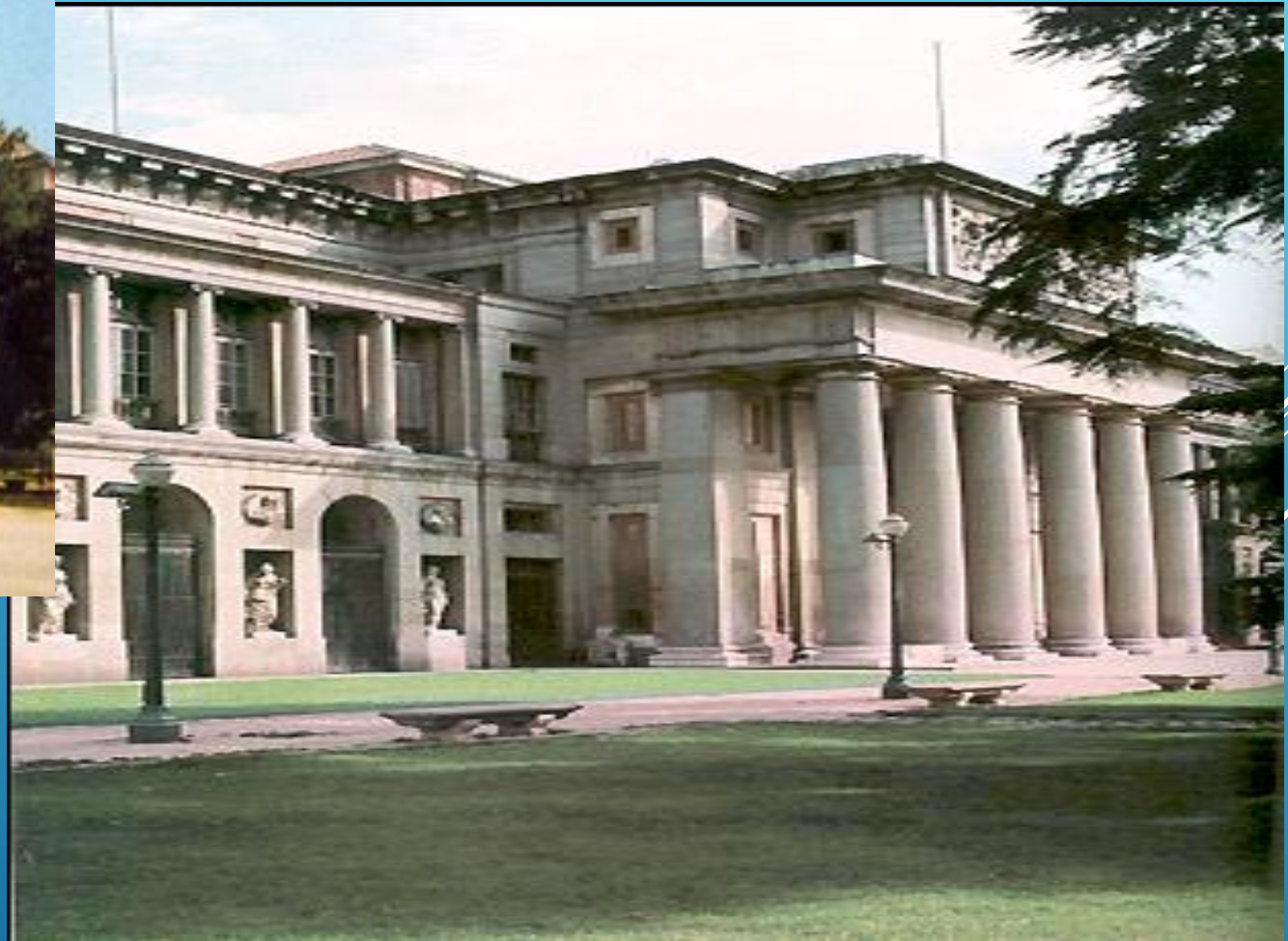
Прадо – национальный музей живописи и скульптуры в Мадриде. (1785-1830) Архитектор Хуан де Вильянуэва