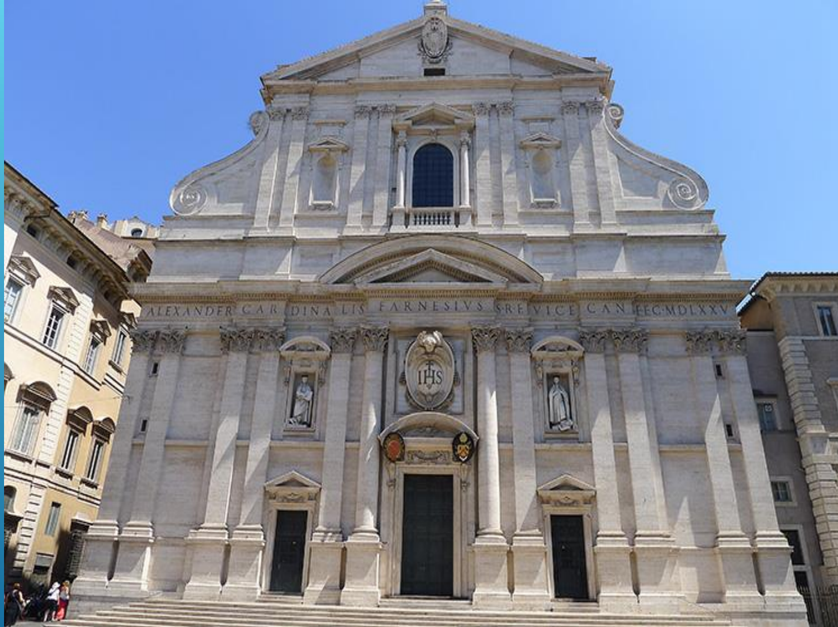
Церковь Иль-Джезу в Риме архитектора Джакомо Бароцци да Виньола