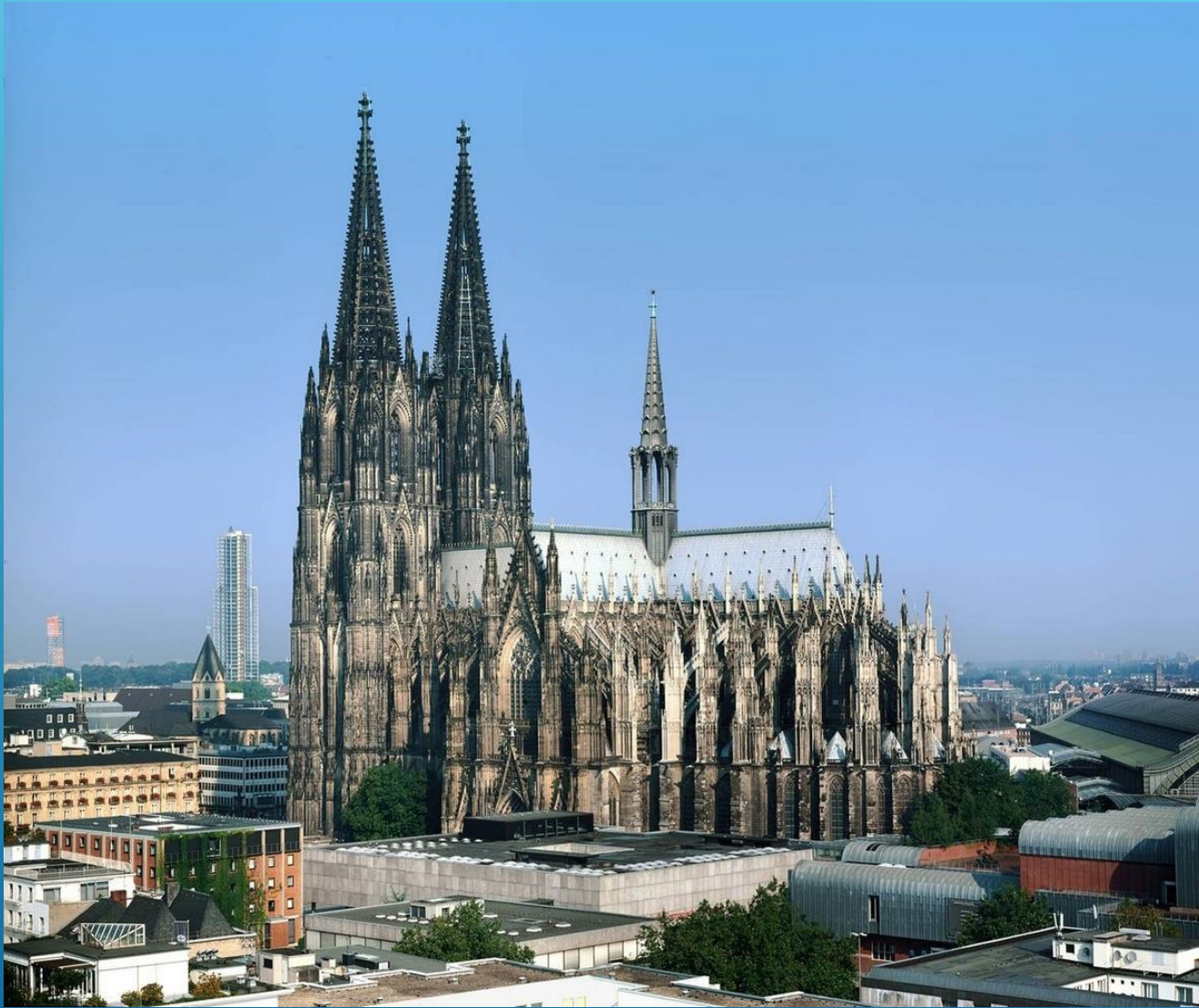
Кёльнский собор, 1248-ХІХ в.