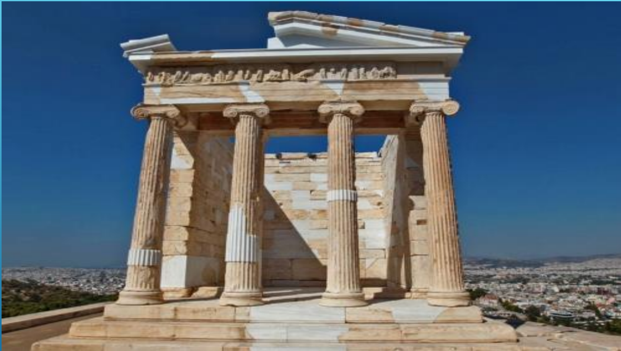
Храм Ники Аптерос (Победы Бескрылой) — ионический храм. 427—424 гг. до н. э. Архитектор Калликрат.