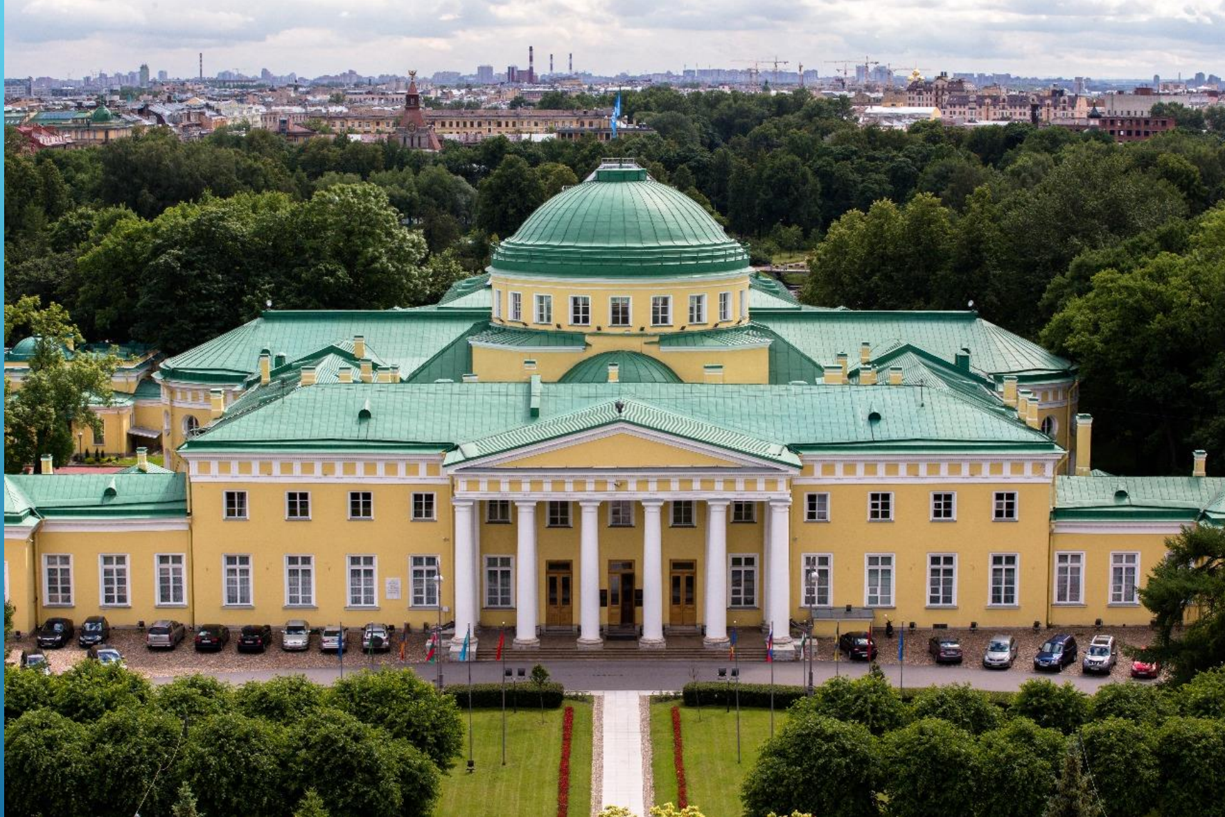
Таврический дворец в Санкт-Петербурге. (1783-1789 гг). Архитектор Иван Егорьевич Старов