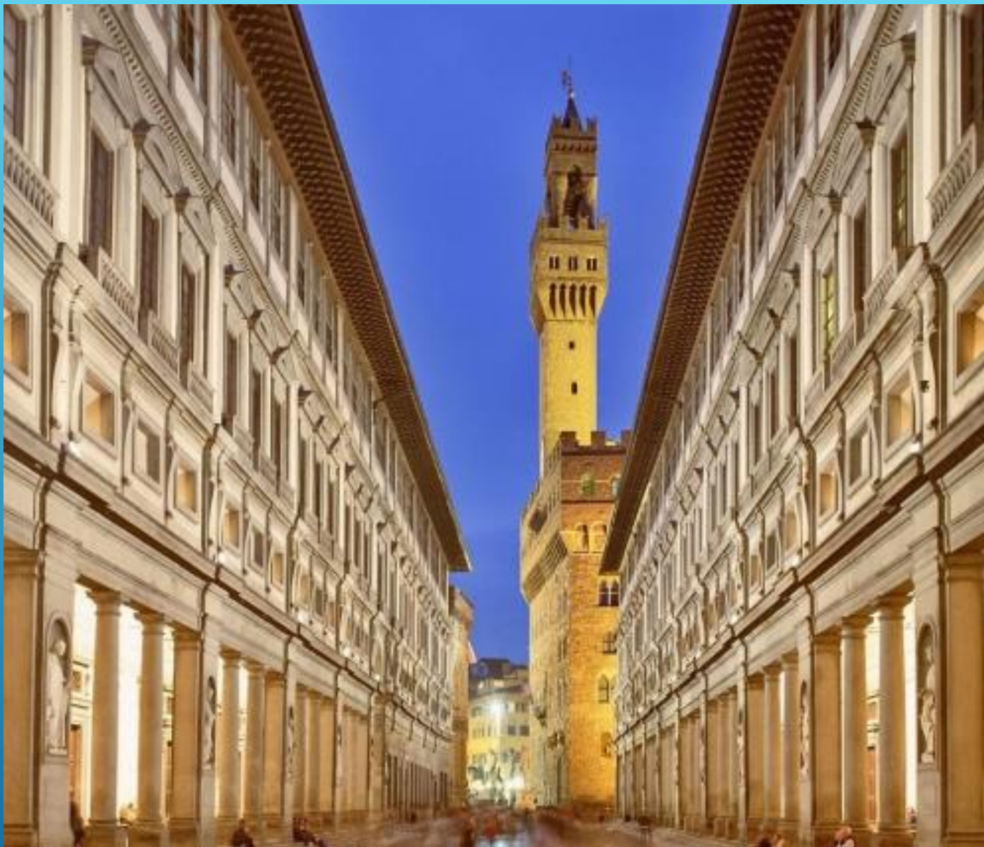
Галерея Уффици (Galleria degli Uffizi) во Флоренции, архитектор Вазари. 1560-1581 гг.