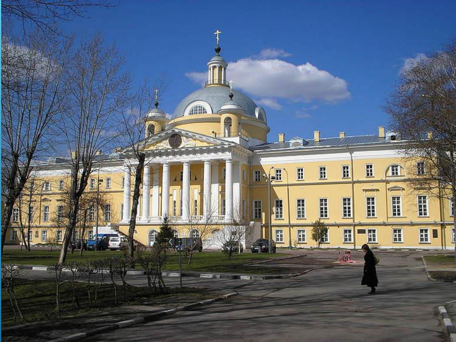
Голицынская больница в Москве. (1796-1801 гг). Архитектор Матвей Фёдорович Казаков