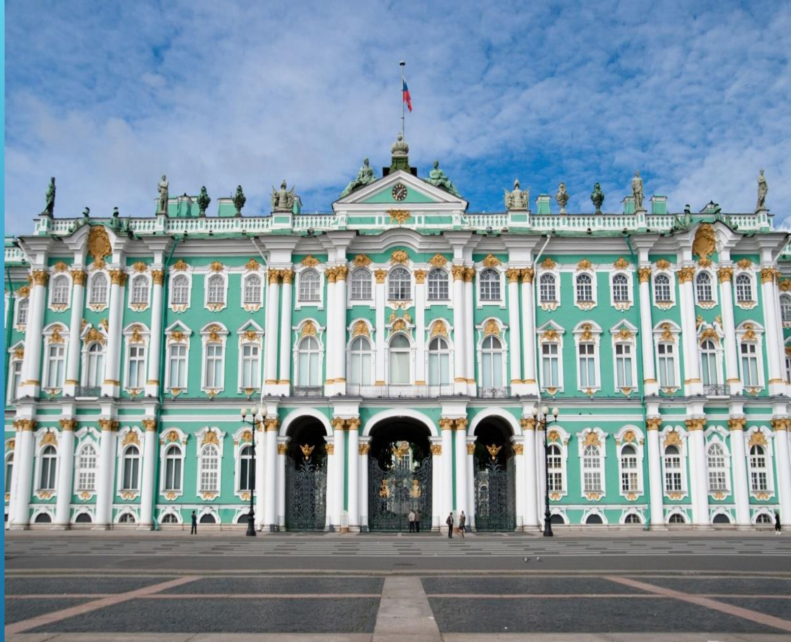
Зимний дворец. Санкт-Петербург.

Бартоломео Франческо Растрелли (1700 — 1771)