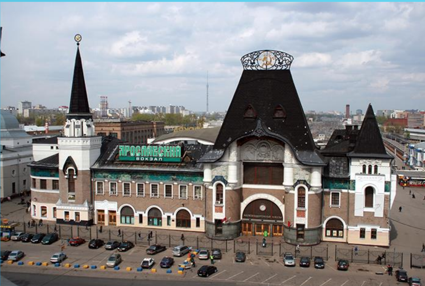
Ярославский вокзал. Москва.(1902-1904 гг) Архитектор Фёдор Осипович Шехтель