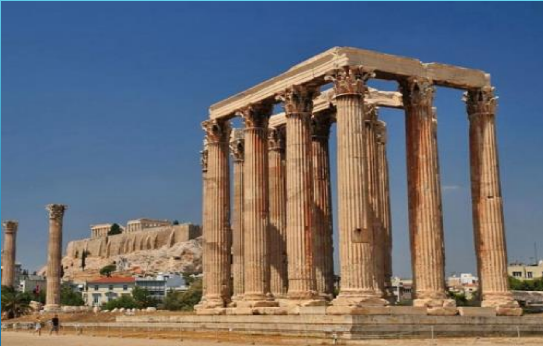
Храм Зевса Олимпийского. Олимпейон в Афинах. 6 век до н.э. – 2 век до н.э.