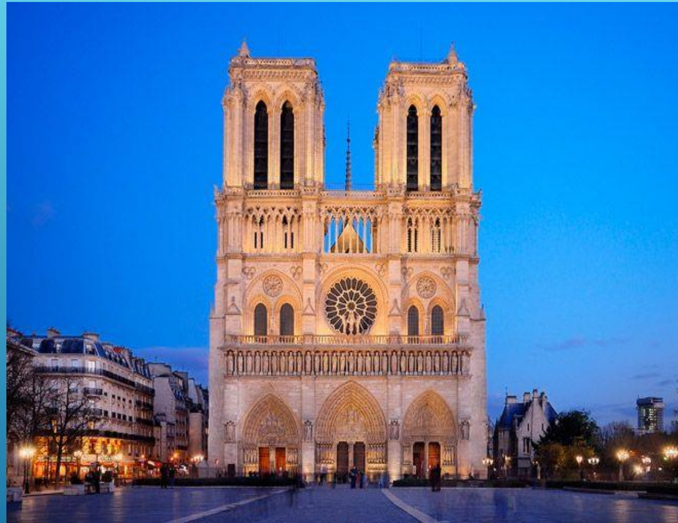
Собор Парижской Богоматери, 1163-XIV в.