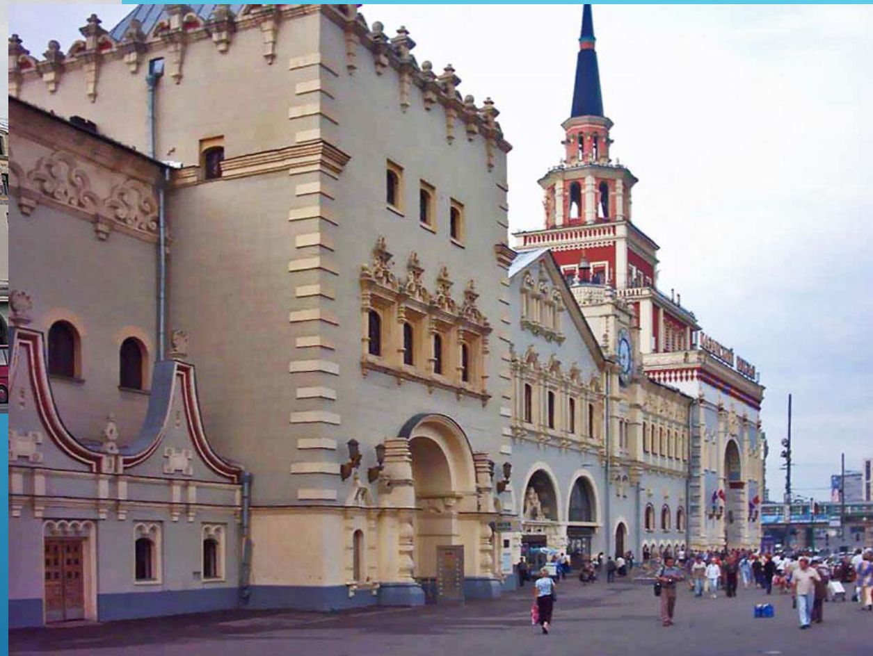
Казанский вокзал в Москве. Архитектор А. Щусев. 1913- 1926 гг.