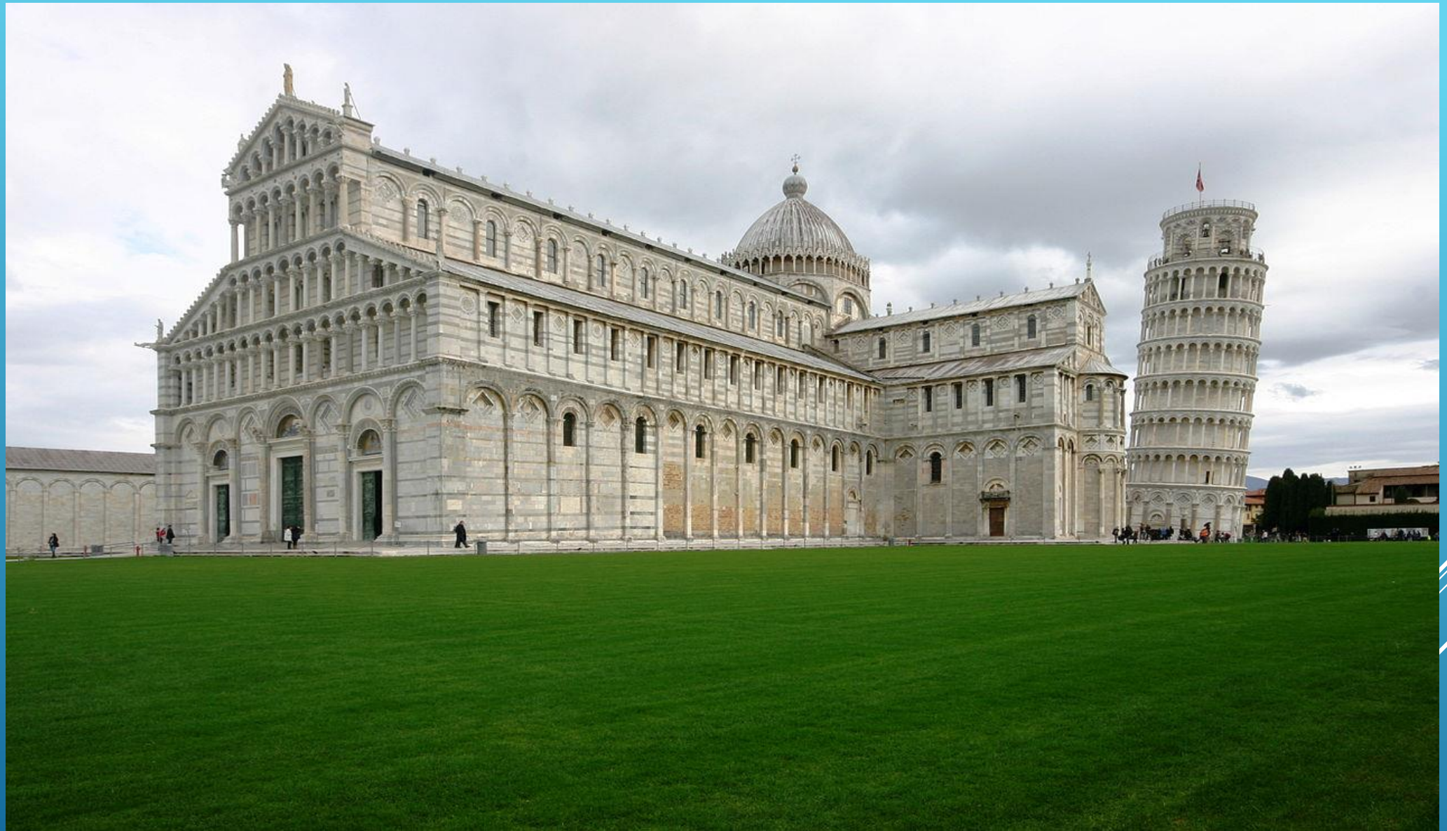
Пизанский собор, Италия