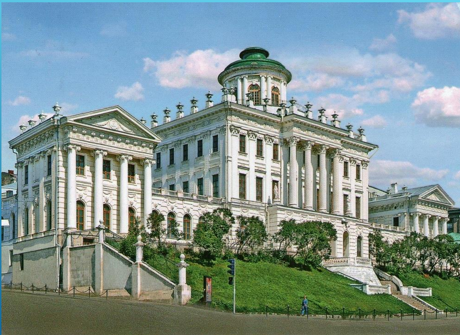
Дом Пашкова в Москве. (1784-1786 гг). Архитектор Василий Иванович Баженов