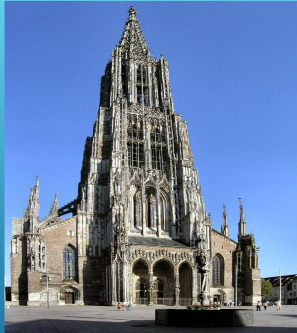
Мюнстерский собор в Ульме, 1377-1543 гг.