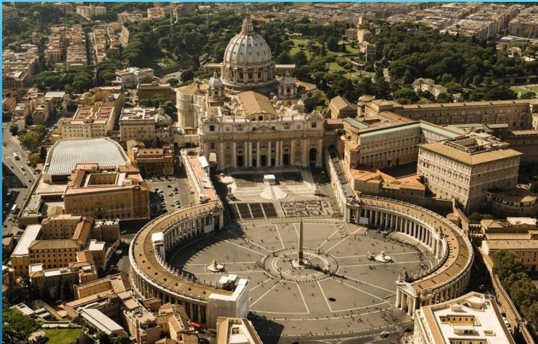
Собор Святого Петра. Рим. Архитекторы: Браманте, Рафаэль, Микеланджело, Бернини.