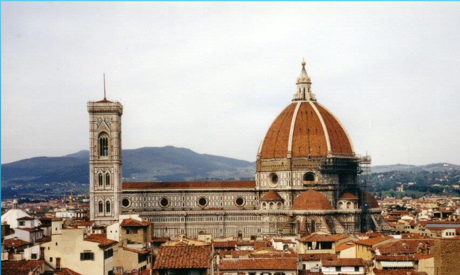
Собор Санта-Мария-дель-Фьоре (итал. La Cattedrale di Santa Maria del Fiore) — кафедральный собор во Флоренции. Архитекторы: Филиппо Брунеллески, Джотто ди Бондоне.